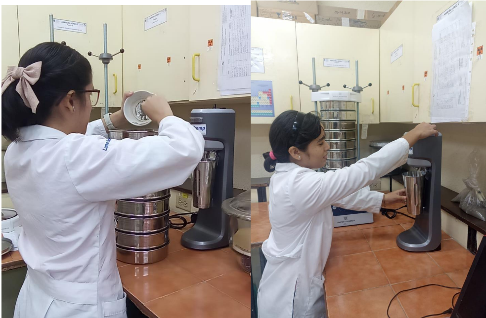
Foto 5. Montaje del análisis de granulometría por personal del laboratorio de Radioquímica Ambiental y estudiantes de la carrera de Química Ambiental de la Facultad de Ciencias en ingeniería de la UNAN-Managua.