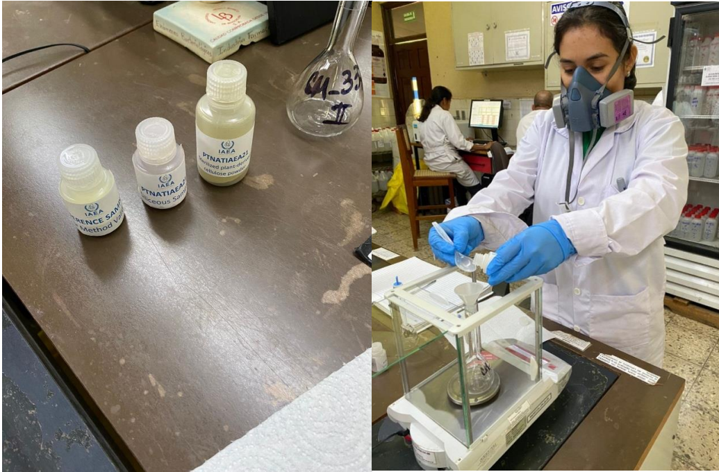
Foto 4. Análisis de metales pesados realizados por el laboratorio de contaminantes metálicos para participar en el ejercicio de intercomparación entre los 18 países que participan en el proyecto RLA5089.

El CIRA/Universidad Nacional Autónoma de Nicaragua (UNAN-Managua). también participó por medio del laboratorio de Contaminantes Metálicos en el ejercicio de intercomparación para realizar análisis de metales pesados (Hg, As, Pb, Cu y Cd) en muestras de suelos (Foto 4).