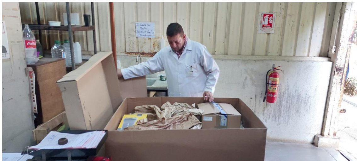
Foto 3. Kit de muestreo donado por el Organismo Internacional de Energía atómica en el marco del Proyecto RLA 5089 òEvaluación del Impacto de Metales Pesados y Otros Contaminantes en Suelos Contaminados por Actividades Antropogénicas y de Origen Natural (ARCAL CLXXVII)ö.

Otra actividad que se llevó a cabo fueron la entrega del Kit de muestreo por el OIEA al laboratorio de Radioquímica Ambiental (Foto 3).