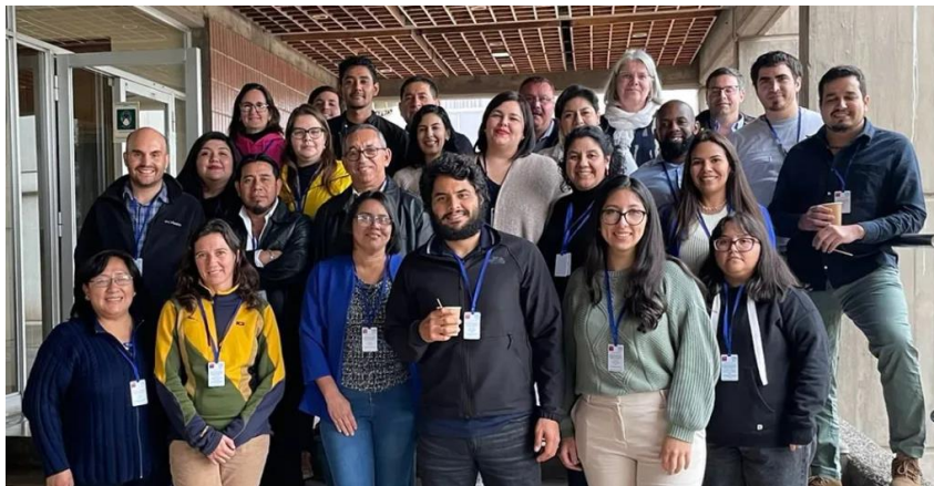
Foto 1. Investigadores de la región fortalecen competencias en estudios de suelos en Santiago, Chile.

Nicaragua participó en la primera reunión virtual el 25 de abril del 2023 con la presentación de las actividades realizadas en el año 2022, así como la presentación de las actividades a realizar en el año 2023. También se participó en el Curso Regional de Capacitación en Protocolo de Muestreo de Suelos Contaminados con Metales Pesados - Preparación de Muestras en las instalaciones de la Comisión Chilena de Energía Nuclear (CCHEN) en Santiago, Chile del 22 al 25 de Mayo del 2023 (Foto 1).