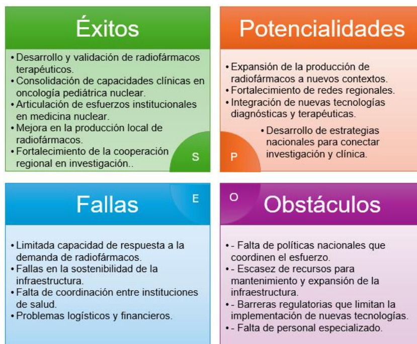
Figura: Análisis SEPO en el área de Salud

A continuación, se presentan los hallazgos más relevantes de cada dimensión del análisis SEPO, destacando las historias de éxito, los desafíos comunes y las lecciones aprendidas de los proyectos.