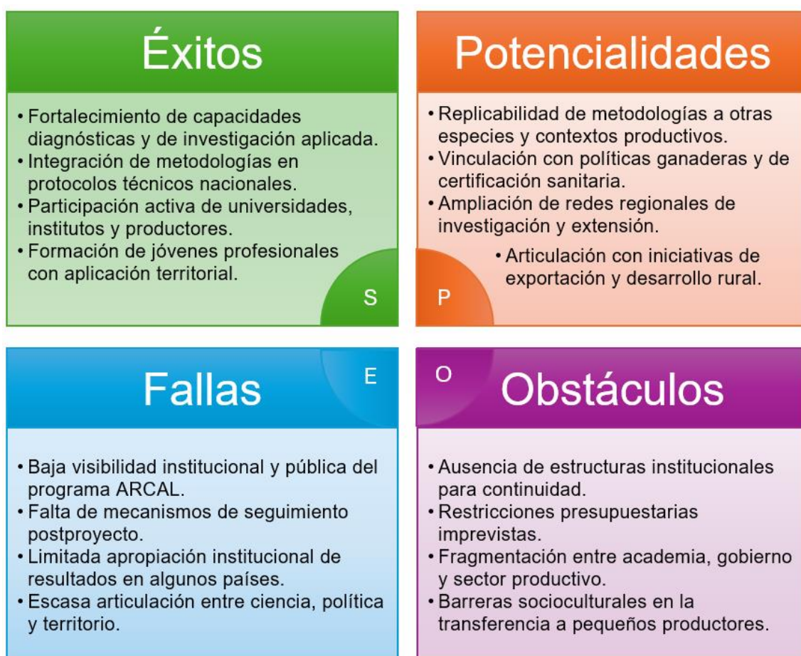
Figura: Análisis SEPO en el área de Alimentación y Agricultura