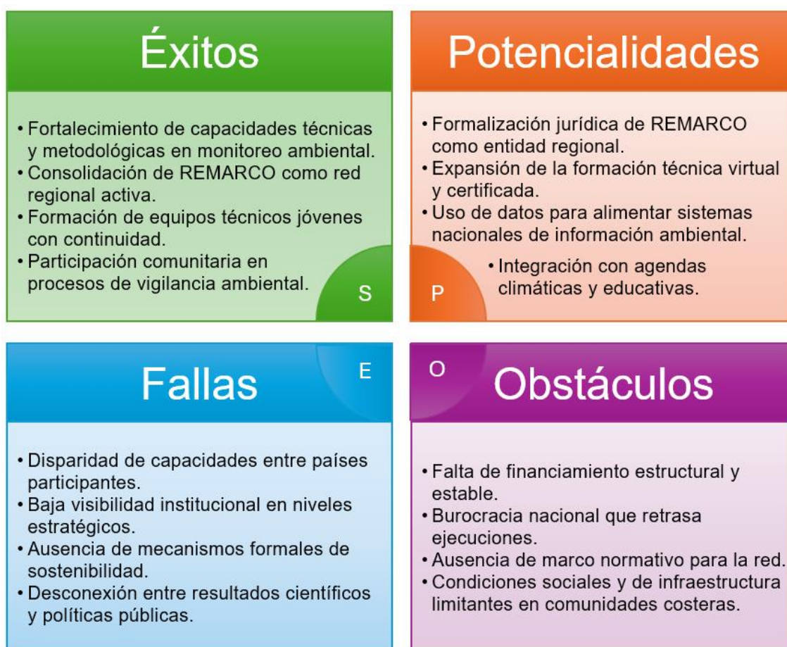
Figura: Análisis SEPO en el área de Ambiente

Con el fin de comprender en profundidad los efectos cualitativos del proyecto RLA7022, se aplicó el modelo de análisis SEPO (Éxitos, Fallas, Potencialidades y Obstáculos), permitiendo identificar percepciones clave desde distintos perfiles de actores involucrados. A través de esta metodología se integraron los hallazgos obtenidos mediante los formularios FFI-1 y FFI-2, así como las entrevistas virtuales y presenciales realizadas con agentes de cambio, tomadores/as de decisión y beneficiarios/as. La triangulación de estas fuentes permitió construir una visión amplia, participativa y equilibrada del desempeño del proyecto en el área temática de Ambiente.