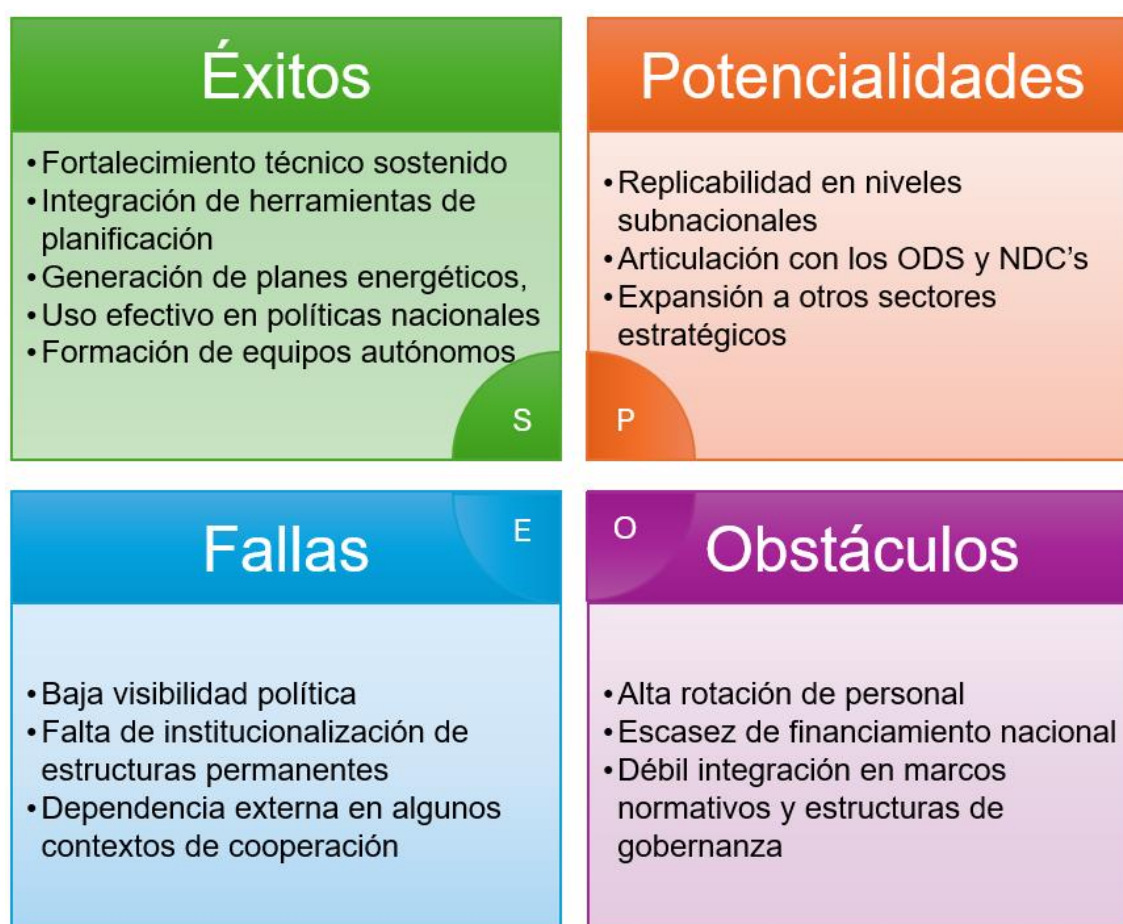
Figura: Análisis SEPO en el área de Energía

Con el fin de comprender en profundidad los efectos cualitativos de los proyectos evaluados, se aplicó el modelo de análisis SEPO (Éxitos, Fallas, Potencialidades y Obstáculos), permitiendo identificar percepciones clave desde distintos perfiles de actores involucrados. A continuación, se presenta una síntesis estructurada de los principales hallazgos, destacando convergencias, desafíos y oportunidades para el fortalecimiento futuro del área temática de Energía.